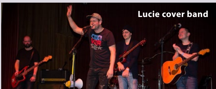
Lucie cover band

Divadelní festival Za Vodou v Kralupech nad Vltavou, pořádá DS Scéna Kralupy ( www.dsscena.cz )