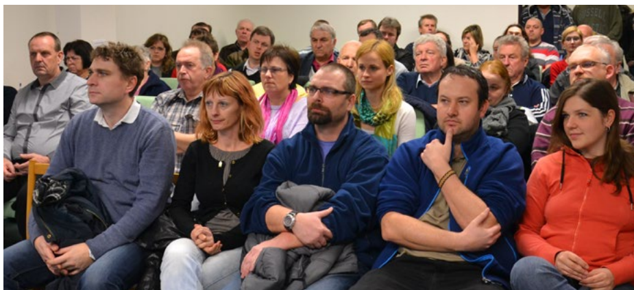
Debata o novém územním plánu přilákala do Volnočasového centra mnoho lidí.