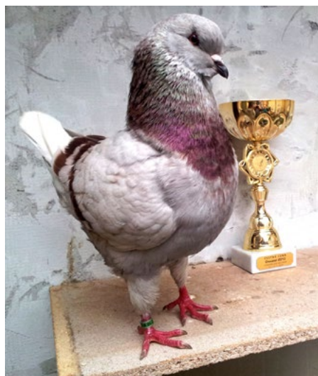
Holub oceněný čestnou cenou na výstavě v Lysé nad Labem.

Holubům se musí čistit a dezinfikovat holubárna, mýt krmítka a napáječky, udržovat je v dobré kondici. To znamená pouštět je ven z holubárny, koupat je a samozřejmě také pravidelně očkovat. Já když přijdu domů ze školy, trávím u holubů většinu času.