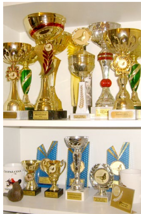
Ve Vaškově „sini slávy“ už se je rozhodně na co dívat.