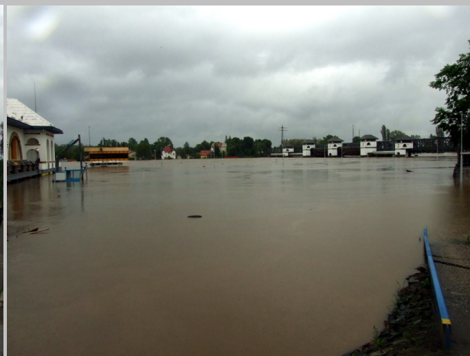
Pohled mezi miřejovickou elektrárnou a železným mostem, 3. června odpoledne