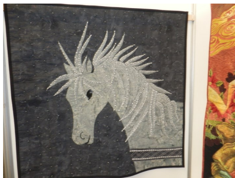
Ukázka díla z pražského setkání příznivců patchworku.