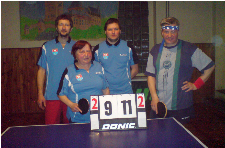
Tým Nelahozeves D