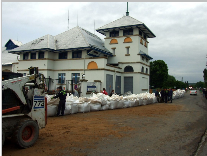
Hráz u miřejovické elektrárny byla postavena přesně ve stejných místech jako v roce 2002. Letos naštěstí nebyla potřeba. (3. června odpoledne)