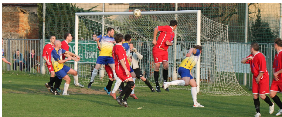
Ze zápasu Dynama s TJ Unhošť, 21. dubna