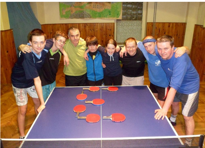
Tým Nelahozeves E